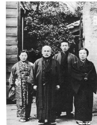
Milieu familial Education