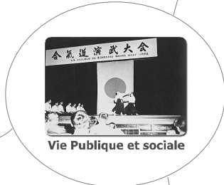
Vie Publique et sociale